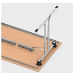
Einfaches Einklappen der Tischbeine