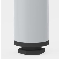
Bodenschoner mit Niveaueausgleich: gleicht Bodenunebenheiten aus