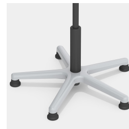
Absolut robustes Alu-Fußkreuz