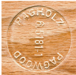
PAGHOLZ® aus nachhaltiger Forstwirtschaft