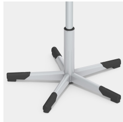
Absolut robustes Stahl-Fußkreuz