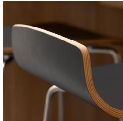
Robuste Buche- Multiplexschale mit kratzfester CPL-Beschichtung