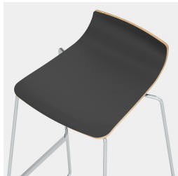
Unsichtbare Befestigung der Sitzschale