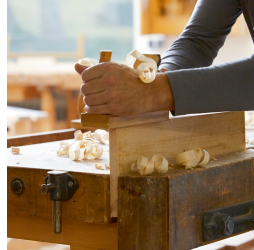
Massives Buchenholz aus nachhaltiger Forstwirtschaft