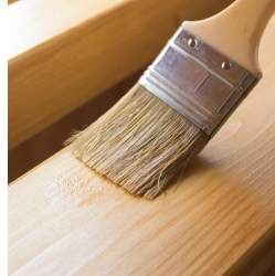
Umweltfreundlich mit Lack auf Wasserbasis lackiert.