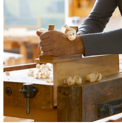
Massives Buchenholz aus nachhaltiger Forstwirtschaft