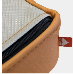
Reißverschluss mit verdecktem Zipper