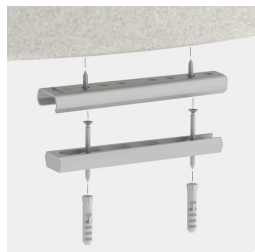
Optional mit geschraubter oder geklebter Bodenbefestigung