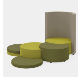
Vielfältige Kombinationsmöglichkeiten der COCOON und JOYN Serien