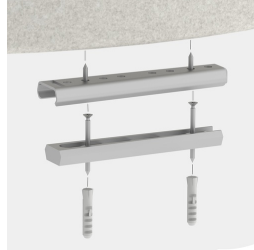
Optional mit geschraubter oder geklebter Bodenbefestigung