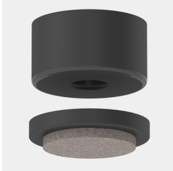
Optional Filz-Bodenschoner mit Wechseleinsatz