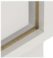
Verzugsfestigkeit durch 8 mm starke Rückwand