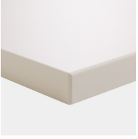
Plattenmaterial melaminharzbeschichtet mit robuster Kunststoffkante