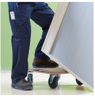
Korpus ab Werk fest verdübelt und verleimt für schnellen Aufbau vor Ort