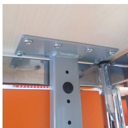
Fest verschraubt mit Tischplatte

Unser Material- und Farbsortiment finden Sie in der ASS Materialübersicht.