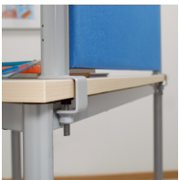
Montage mittels Inbusschraube an der Tischplatte