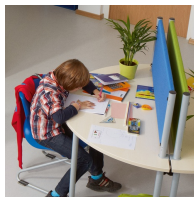
Ideal als Blick- und Schallschutz