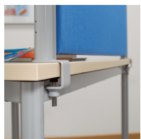
Montage mittels Inbusschraube an der Tischplatte