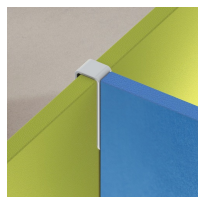
Verbindung von T-förmigen Trennwänden