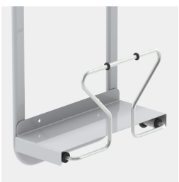
Einfach Befestigung des CPU-Halters mit Einlegeblech