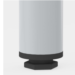
Bodenschoner mit Niveauegleich: gleicht Bodenebenheiten aus