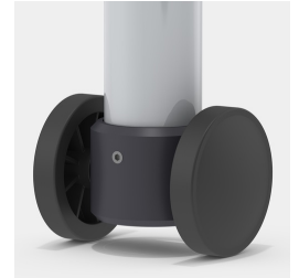
Optional Gestell fahrbar mittels 2 Bockrollen