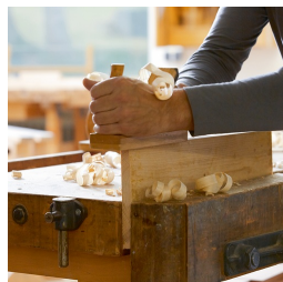
Massives Buchenholz aus nachhaltiger Forstwirtschaft