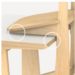
Schoner schützen Tischplatte beim Aufstuhlen