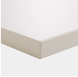
Plattenmaterial melaminharzbeschichtet mit robuster Kunststoffkante