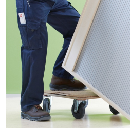
Korpus ab Werk fest verdübelt und verleimt für schnellen Aufbau vor Ort