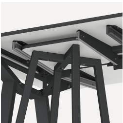
Halterung für FLEXLAB Hocker und Tidy Boxen