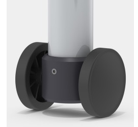
Optional Gestell fahrbar mittels 2 Bockrollen