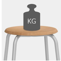
Robustes 4-Bein Gestell