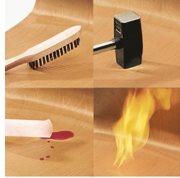
Unverwüsthche PAGHOLZ®-Schale, kratz-, bruch-, stoßfest und hitzebeständig