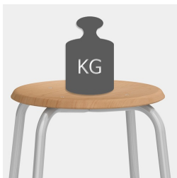
Robustes 4-Bein Gestell