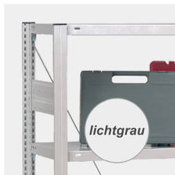
Cadre robuste en acier