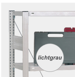
Cadre robuste en acier