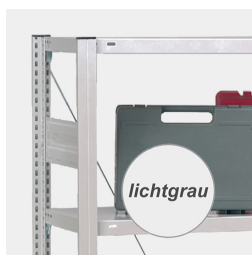
Cadre robuste en acier