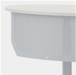
Cache frontal en tôle perforée inclus