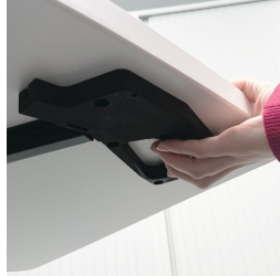
Le déclencheur manuel de sécurité empêche le déclenchement involontaire du réglage de la hauteur