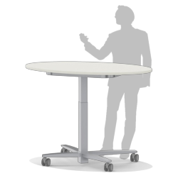
Peut également être utilisé comme pupitre mobile