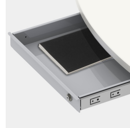
En option, tiroir pour casier de valeur en acier verrouillable