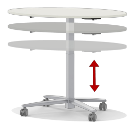
hauteur réglable en continu sur une plage de 71 à 110 cm