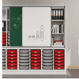
Tableau coulissant avec rails de guidage en aluminium et espace de rangement supplémentaire derrière les tableaux

matériau du plateau en mélaminé avec chants robustes en plastique